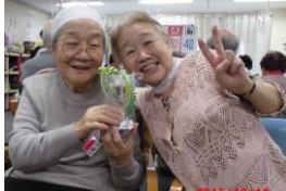
今日は白組の勝利よ！