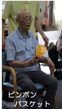
ピンポン バスケット