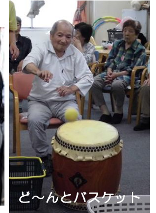
ど～んとバスケット